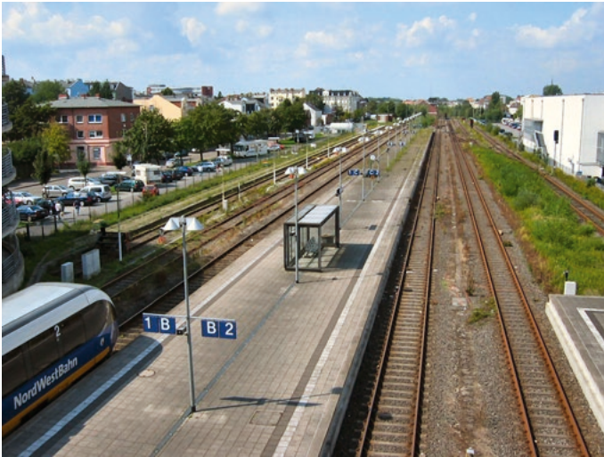
Bahngleise in WHV