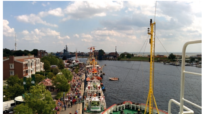
Flaniermeile am Bontekai

men nutzen Mitarbeiter aus der Touristikbranche von Nah und Fern die Chance, Ihre Destination: Besonderheiten, Ausflugsziele und Angebote, an den besucherstärksten Tagen zu präsentieren. Das ist bestimmt ganz spannend und interessant für Euch als Tourismusabsolventen.