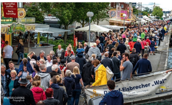
Trubel am Bontekai

onale Essenspezialitäten oder das Stöbern bei zahlreichen Händlern - hier kommt jeder auf seine Kosten. Zum Abend gibt es ein tolles Open-Air-Programm auf mehreren Bühnen, und auch das traditionelle bayrische Festzelt ist in diesem Jahr wieder vertreten. Auch ein Riesenrad oder das Besichtigen zahlreicher Schiffe, ob vor Anker oder auf einer kurzen Fahrt, warten auf Euch. Am Marinearsenal präsentiert sich die Bundeswehr als wichtiger Partner des Wochenende an der Jade.