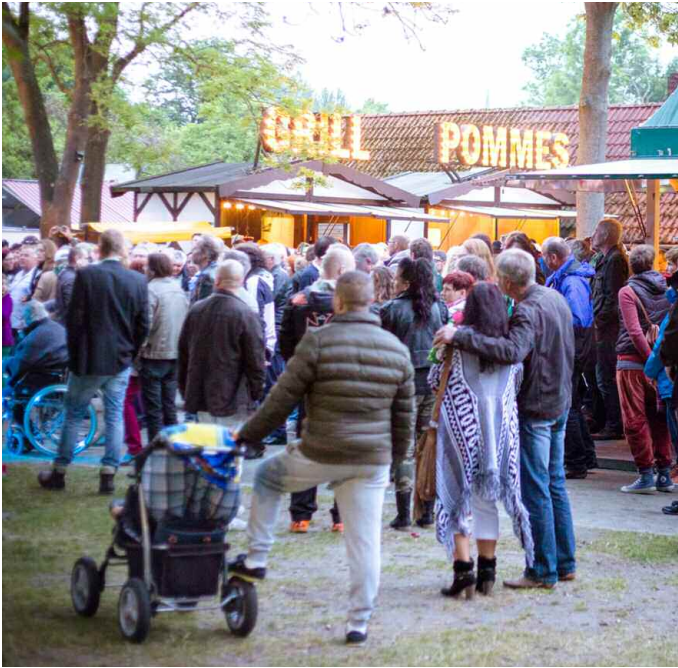
Für echte Verstärkung sorgte der Grill und Pommesstand.