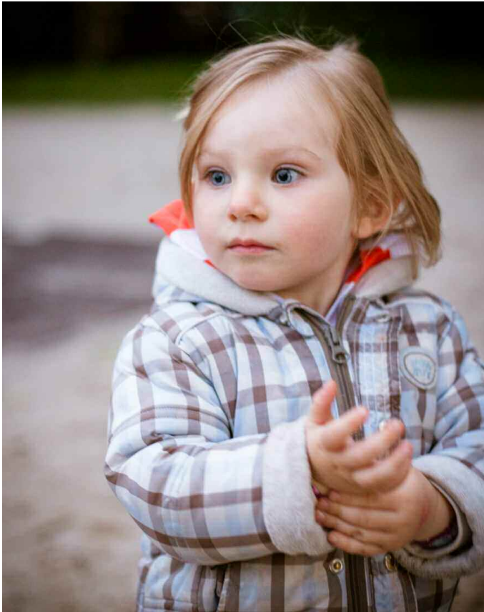
Auch die Kleinsten hatten ihre Freude am musikalischen Mittwochprogramm.