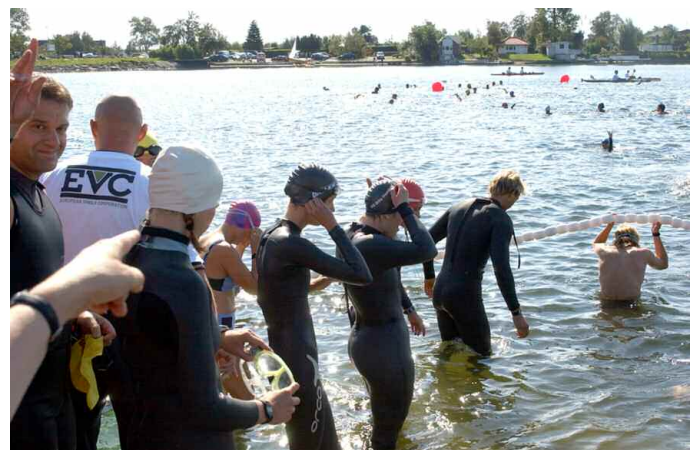
Ab ins kühle Nass geht's für die Triathleten.

Sportlich geht`s dagegen am 8. und 9. August beim 27. NordseeMan- und NordseeWoman-Triathlon zu. Bereits zum zehnten und zum fünften