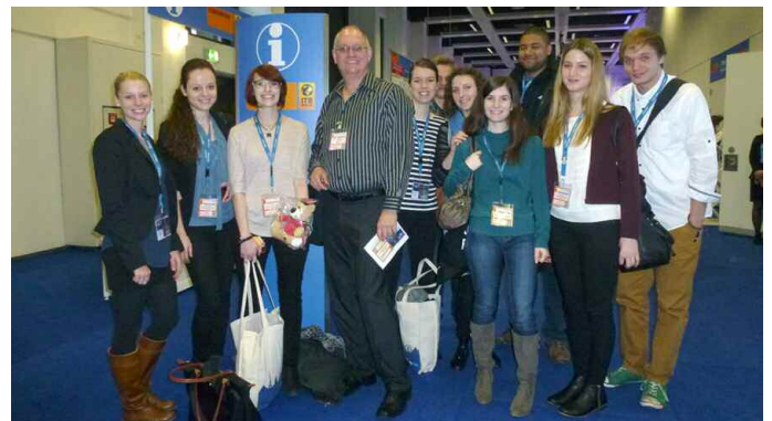
Studierende des Studiengangs „Tourismuswirtschaft deutsch-französisch“ reisten mit zur ITB nach Berlin.