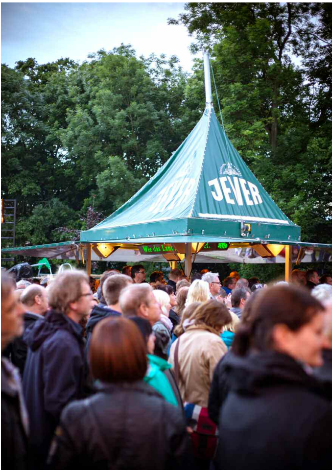
Und zur Erfrischung ein kühles Jever?