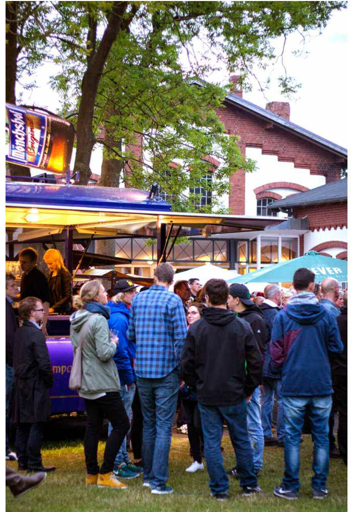
...der Bierwagen steht zum Glück nicht weit entfernt.